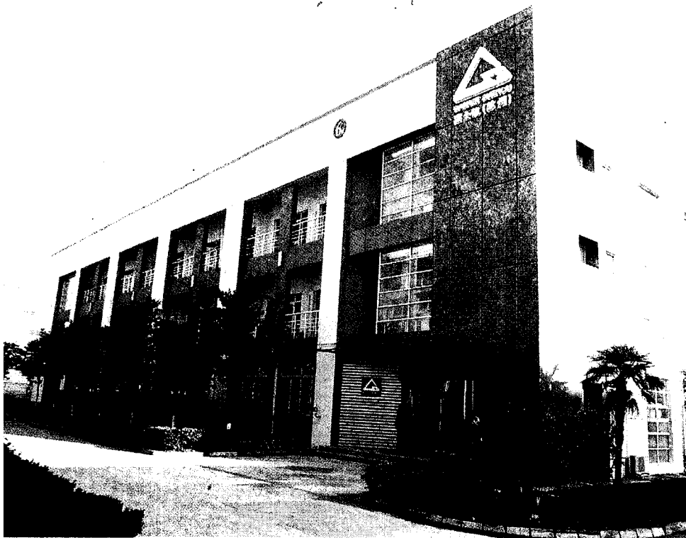
Lo stabilimento aperto due anni fa in Cina dalla Gasket International

Evento organizzato dalla Fondazione Italia Cina e Mf